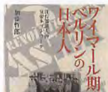
加藤哲郎「ワイマール期ベルリンの日本人」

本社・営業部 東京都千代田区神田 2-7-8 〒101-0085 ☎ 3263-8141 90 システムセンター 千代田区神田三城町 2-1-7 〒101-0081 ☎ 3263-0146 ~ 8