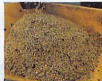
完熟したドミニカバラオナのチェリー▲

の近接性の影響を受けて寒暖差が生ま れることで果実の熟成が長くなることで独特 な風味が得られ ます。ナッツの様 な香ばしさとビス ケットの様な甘味 が特徴です。