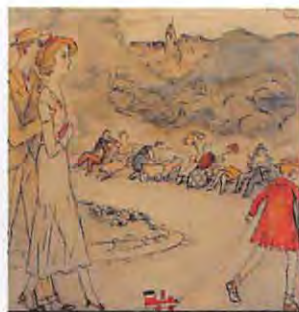
竹久夢二「ベルリンの小公園」