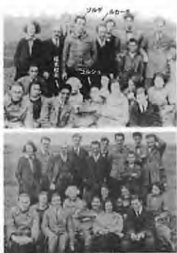
「マルクス主義研究会」 上 福本あり、下 捕まりなし

このウィキペディア日本語版・英語版の創設時の記述には、誤りがある。「一九二二年夏イルメナウ」というマルクス主義研究会(研究週間という)は、実は「二三年五月ゲラ」であった。