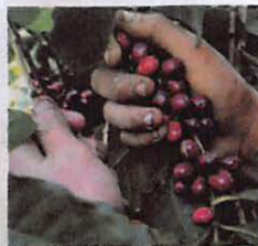
▲エル・シプレス農園ブルボンチェリー

(471) エルサルバドル・エル・シプレス農園ブルボン Flavor Sweet 〜クリーミーな口当たりと、和三盆の様なやわらかな甘味。〜